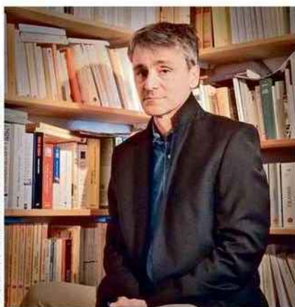
PRESSE/EDITIONS PIERRE-GUILLAUME DE ROUX